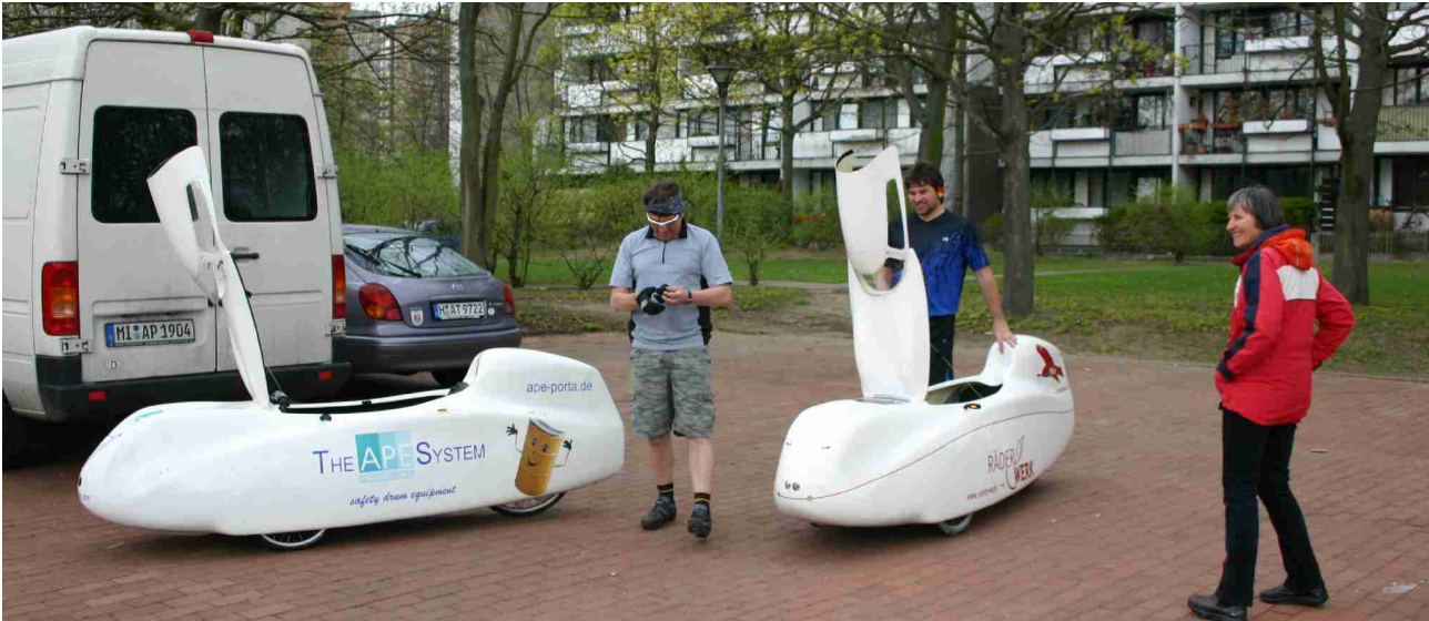
Erstmals waren bei unserer RTF zwei vollverkleidete Liegeräder am Start

Während unserer Mitgliederversammlung am 25. Januar 2013 werden unsere RTF-Fahrer geehrt und sie erhalten die Auszeichnungen des Verbandes und des Vereins.