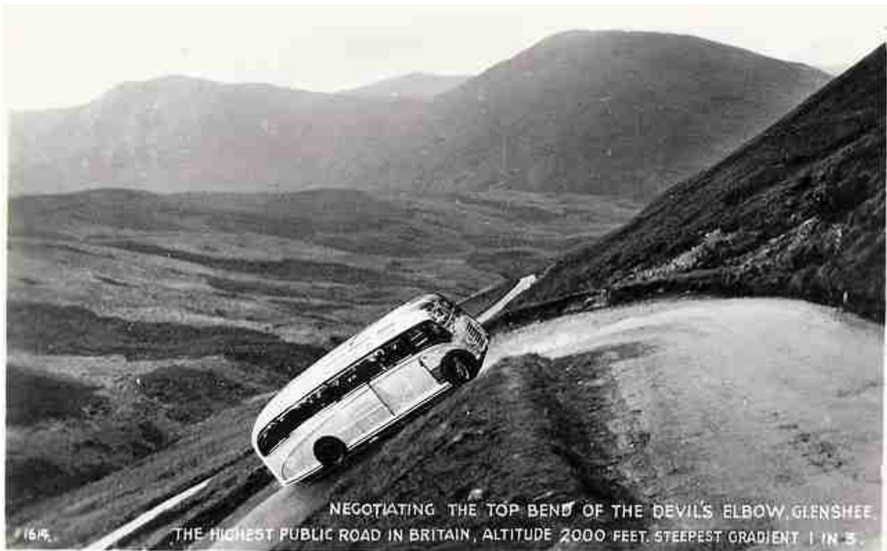
Devil's Elbow (30%) - historische Postkarte

Für die anderen geht es nun stetig bergan und ein mittlerer Wind will uns ebenfalls die Auffahrt erschweren. Und die 15 km ziehen sich ganz schön hin, bis die Passhöhe mit dem Glenshee Ski Centre erreicht ist. Dafür erwartet uns ab dort eine Genuss-Abfahrt bis hinunter nach Spittal of Glenshee. Anfangs schieben uns bis zu 12% Gefälle an. Bekannt ist die Passstraße an dieser Stelle durch den sogenannten Devil's Elbow: eine Doppelkehre mit Steigungswerten um die 30% (!) - oder "one in three", wie die Einheimischen sagen. Leider ist dieser Leckerbissen dem Fortschritt des Straßenbaus zum Opfer gefallen; und so müssen wir uns mit maximal 12% bergab begnügen, die das Bike auf einer top geglätteten Fahrbahn mit großen, übersichtlichen Kurvenradien rollen und rollen zu lassen.