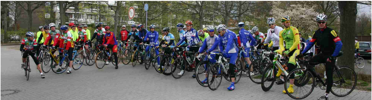
So sah es beim Start 2012 aus

Höhepunkt unserer diesjährigen RTF-Saison war die erfolgreiche Durchführung der Laatzener Frühjahrs-RTF Ende April. Etwa 200 Teilnehmer gingen bei wechselhaftem Aprilwetter auf die Strecke. Dank unseres perfekten Helferteams klappte alles bestens und wir dürfen uns schon jetzt auf eine Neuauflage der Veranstaltung am 20 April 2013 freuen.