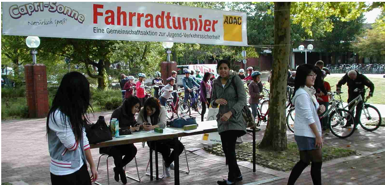
Bei der Buchführung

Stahlrad Laatzten von 1897 e.V. Alte Rathausstr. 12 30880 Laatzten Telefon: 0511 82 85 24 / 8604 247 Internet: WWW.STAHLRADLAATZEN.DE