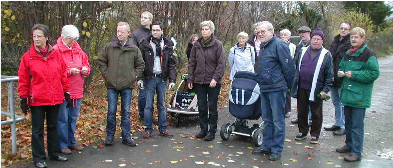
Startaufstellung beim Boßeln in der Leinemasch

Bei trübem aber trockenem Novemberwetter haben sich die Radsportler des Stahlradvereines am 25. November zum Boßeln in der Leinemasch getroffen. Vom Restaurant "Zur Leinemasch" ging es bis zum Rodelberg und zurück. Anschließend wurde im Restaurant mit weiteren Vereinsmitgliedern das traditionelle Wurstessen genossen.