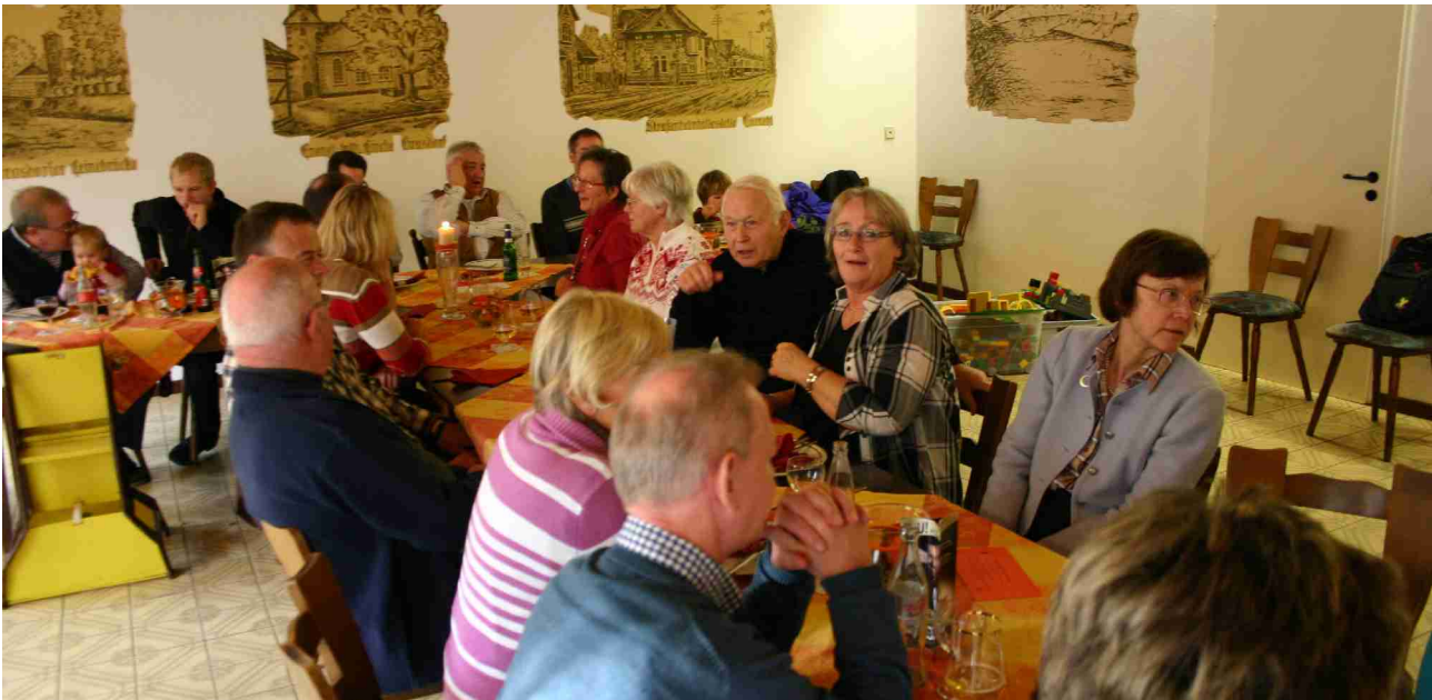
Leckeres Wurstessen mit Grünkohl im Restaurant „Zur Leinemasch“

Bei trübem aber trockenem Novemberwetter haben sich die Radsportler des Stahlradvereines am 25. November zum Boßeln in der Leinemasch getroffen. Vom Restaurant "Zur Leinemasch" ging es bis zum Rodelberg und zurück. Anschließend wurde im Restaurant mit weiteren Vereinsmitgliedern das traditionelle Wurstessen genossen.