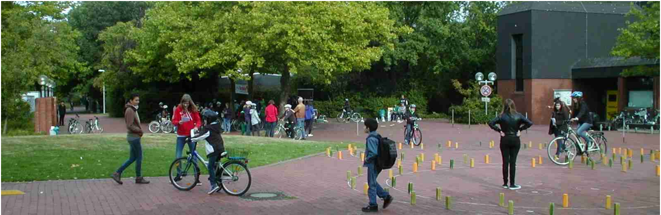
Blick über den Parcours

Insgesamt haben über 80 Schüler an dem Turnier teilgenommen, von denen kaum einer den Parcours fehlerfrei durchfuhr. Überhaupt ließ die Fahrradbeherrschung sehr zu wünschen übrig, ganz zu schweigen von der Verkehrssicherheit der Fahrräder. Manche Eltern haben beispielsweise ihre Kinder ohne funktionierende Bremsen fahren lassen und viele hatten keinen Schutzhelm dabei. Allerdings durfte kein Kind ohne Helm an dem Turnier teilnehmen, so dass die Helme hin und her getauscht wurden.