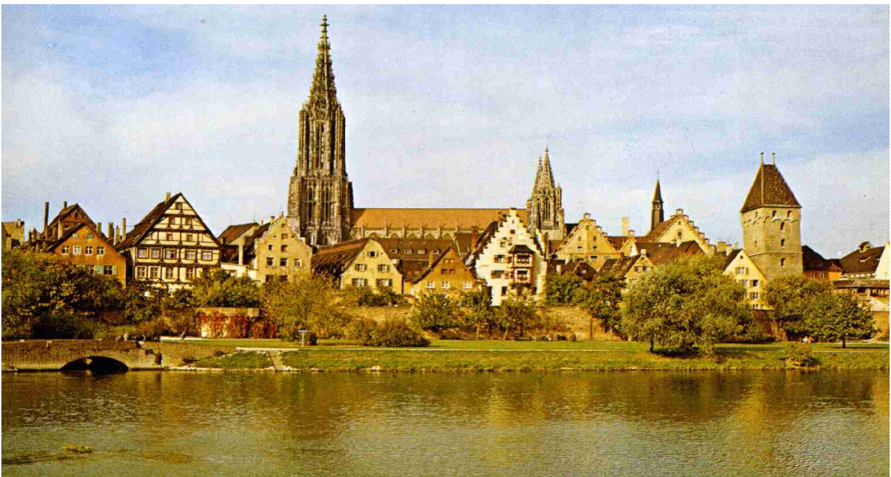
Die Donau vor dem Münster