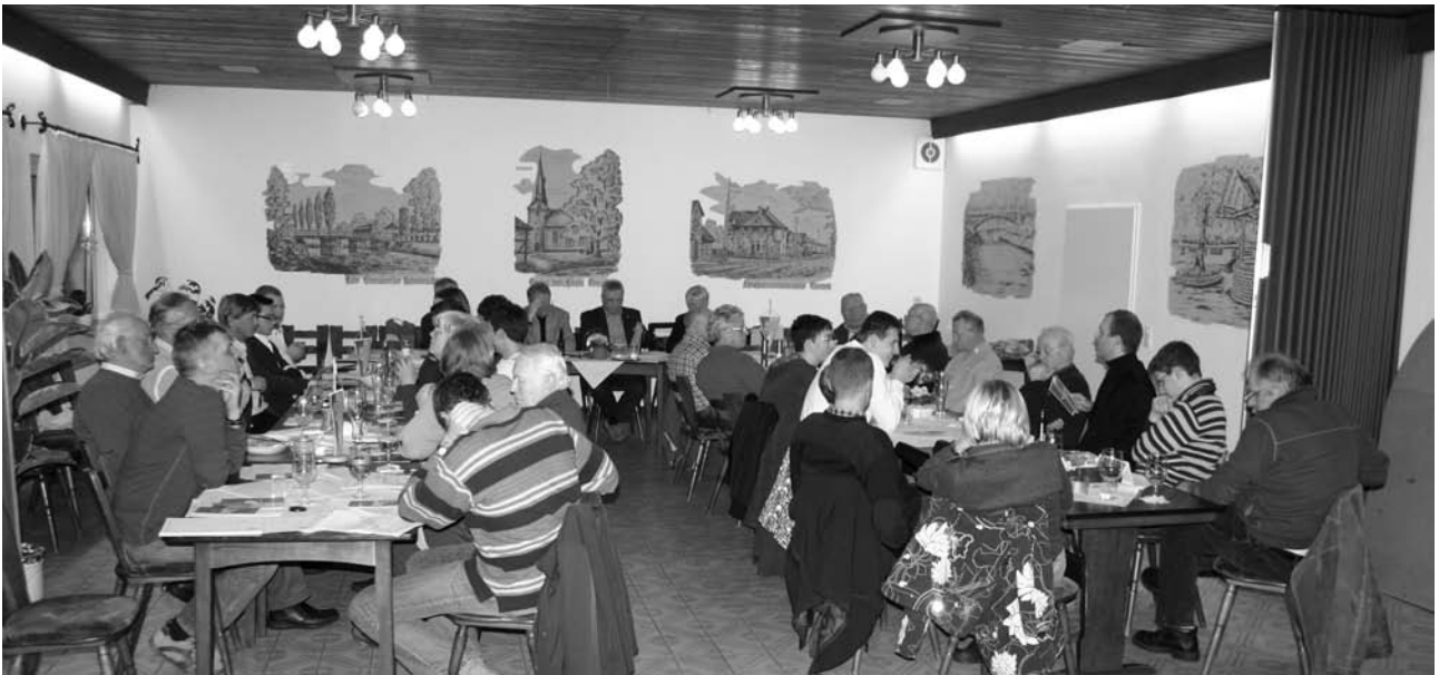
Blick in den Versammlungsraum im Restaurant „Zur Leinemasch“