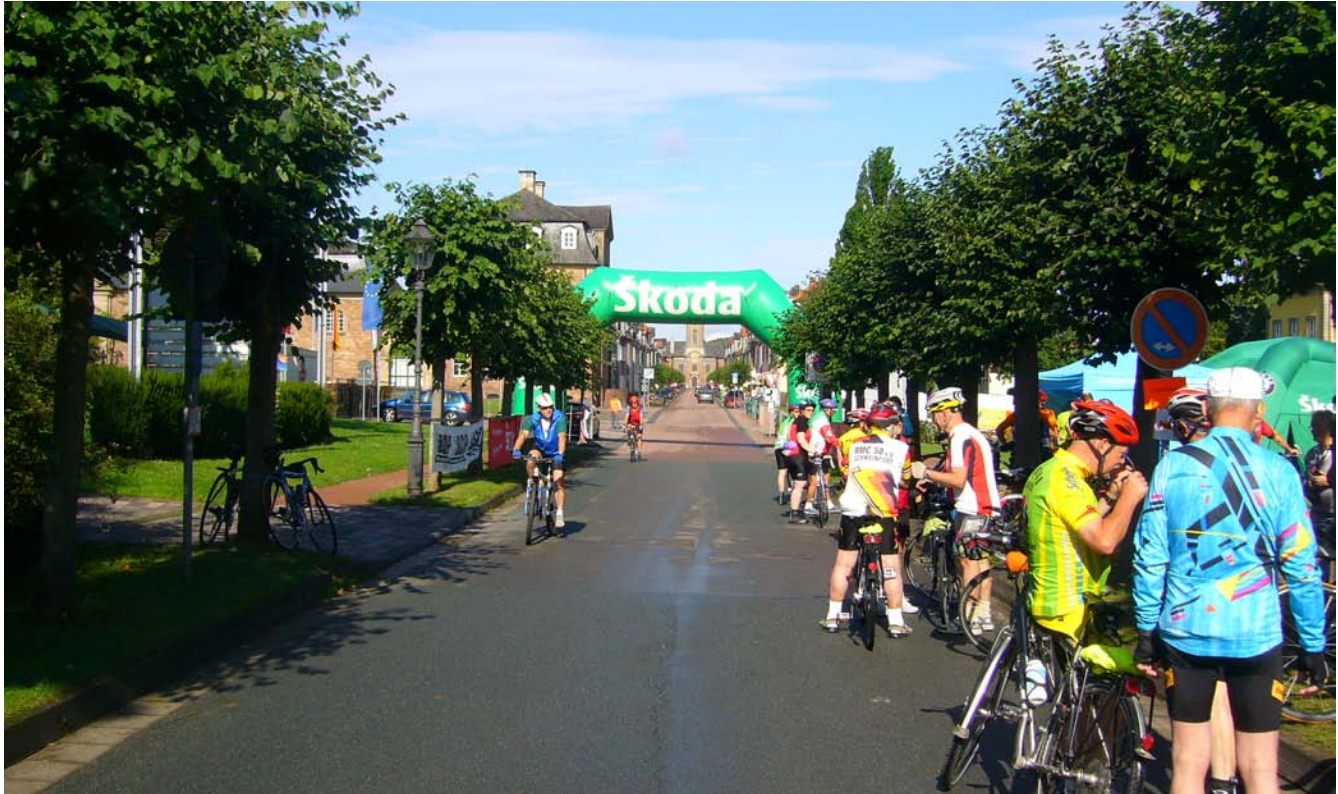
Start/Ziel in Arolsen

dieser wohlverdienten Erholungspause weitergeht zur Luise-Mühle in Mengerlinghausen. Hier erwarten uns Sauna, Schwimmbad und später ein gutschmeckendes Abendessen mit unseren Kameraden. Trotz Umwegen und Radeln auf der 100km-Strecke, sind wir nur auf 78 km gekommen. Vielleicht haben wir noch ein Schild übersehen?