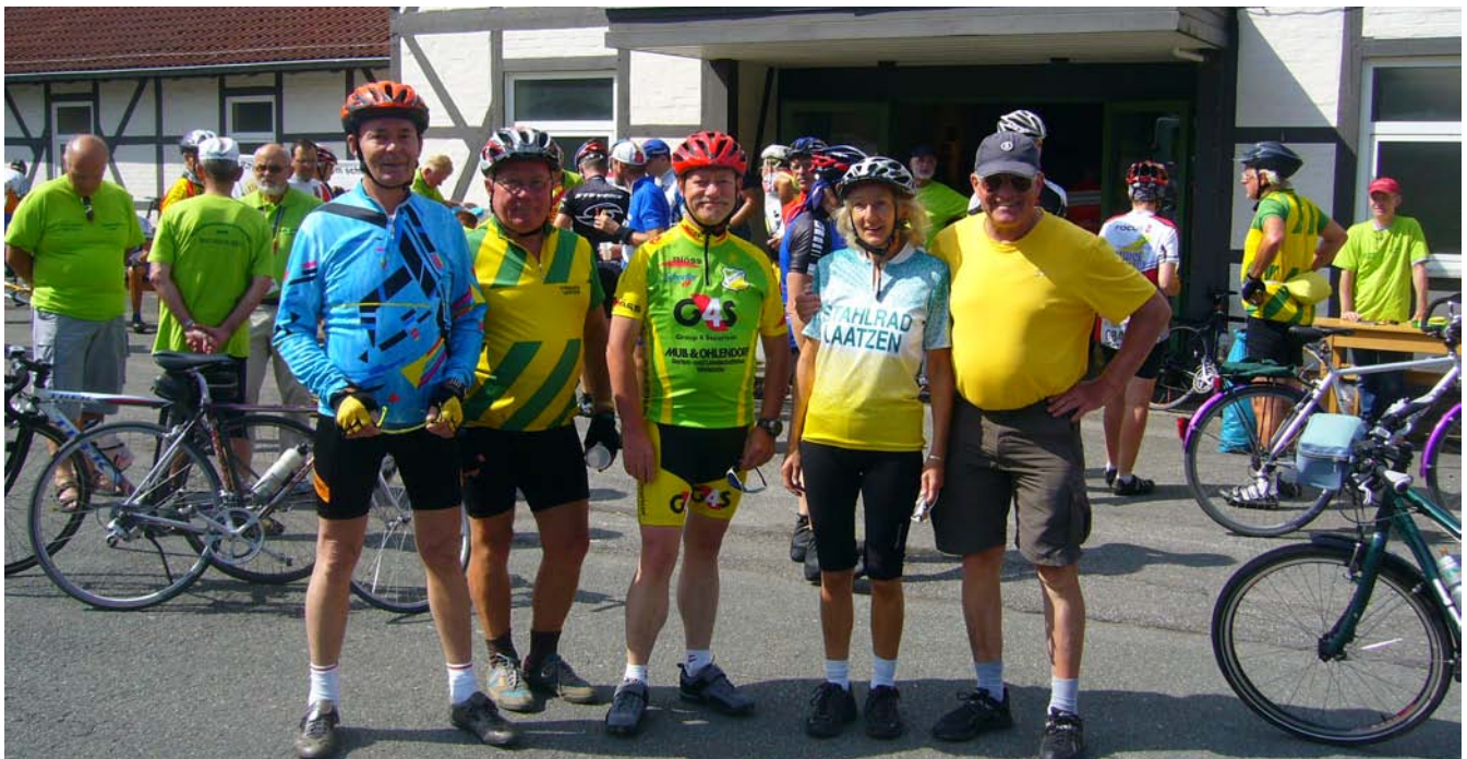
Kurz vor dem Start

Heute scheint die Sonne und wir wollen an einem ausgeschilderten Rundkurs – an einer RTF (Rad-Touristik-Fahrt) – teilnehmen. Die RTF-ler können sich bei den Rundkursen innerhalb einer Woche, Punkte für ihre Jahreswertungskarte sammeln. Mit der Teilnahme am heutigen Rundkurs ergibt sich die Möglichkeit, dass die beiden Sparten RTF und Radwandern/ -trekking von Stahlrad Laatzten auch wieder einmal gemeinsam radeln können. Zur Teilnahme an der RTF müssen wir uns am Start beim Welcome-Hotel Residenzschloss anmelden (hier ist auch das Ziel) und erhalten eine Nummer zum Anheften auf den Rücken und eine Wege-/ Straßenkarte.