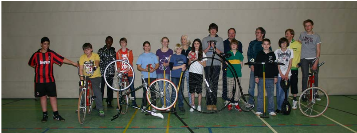
Die Projektgruppe mit Hochrad

Insgesamt gesehen war die Aktion ein toller Erfolg. Die Schüler waren mit Begeisterung dabei und haben mal etwas anderes als nur immer Fußball kennengelernt. Vielleicht hat ja der eine oder andere bei dem Projekt eine neue Herausforderung für seine sportlichen Aktivitäten entdeckt. Wir vom Stahlradverein haben die Teilnehmer motiviert, mal beim Radsporttraining probierhalber mitzumachen, um dann Gefallen daran zu finden.