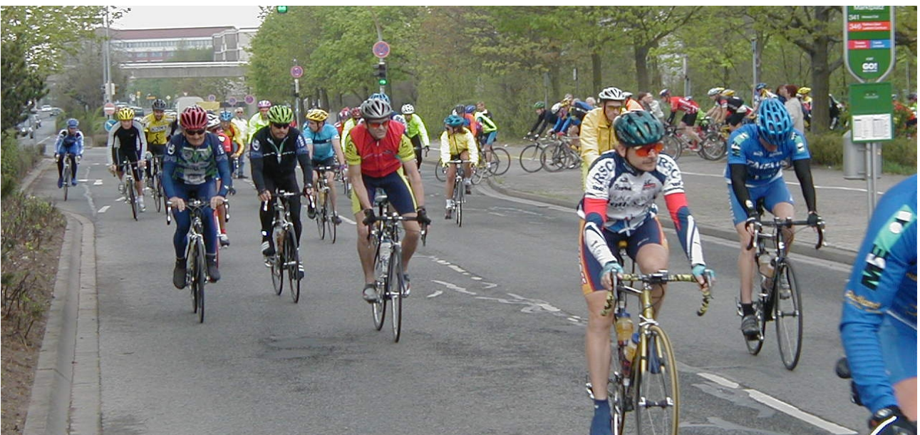
Die Fahrt hat begonnen