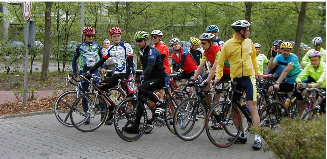
Vor dem Start

Es werden wieder drei Strecken verschiedener Länge angeboten. Für nicht ganz so geübte Radler bietet sich eine Streckenlänge von 45 km an. Wer schon etwas besser trainiert ist kann sich auf den Streckenlängen über 77 km und 113 km an der frischen Frühlingslandschaft erfreuen. Die längste und schönste Tour führt bis in das wellige Harzvorland.