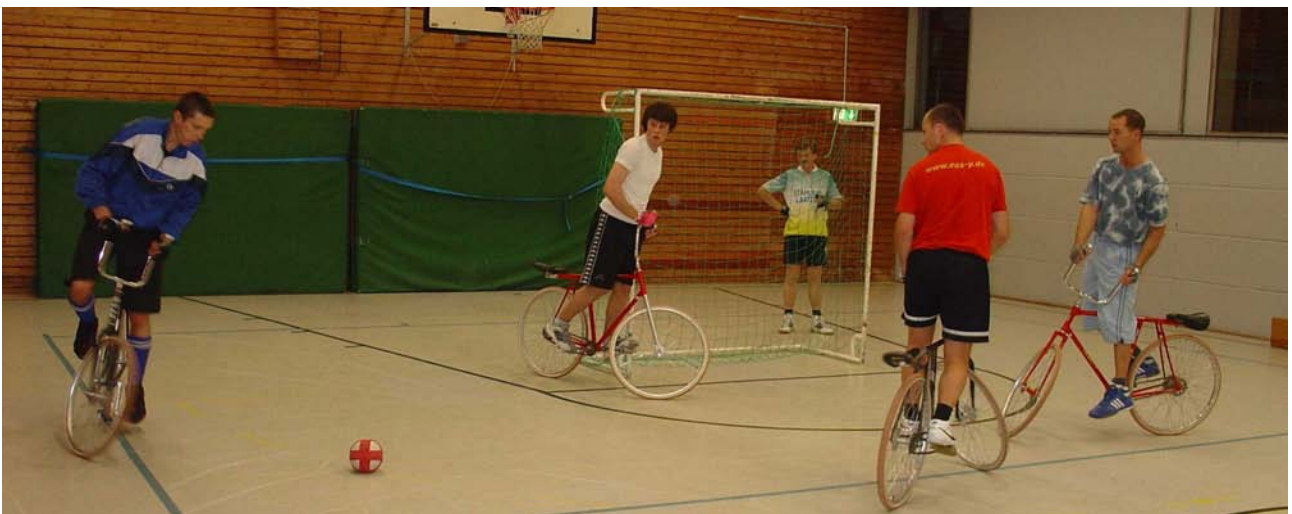
Radballtraining in der Sporthalle der Schule Alte Rathausstraße