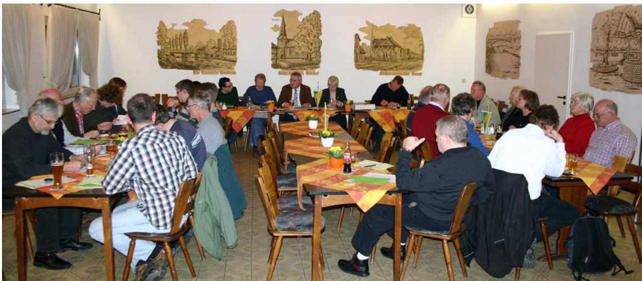
Blick in die Versammlungsrunde