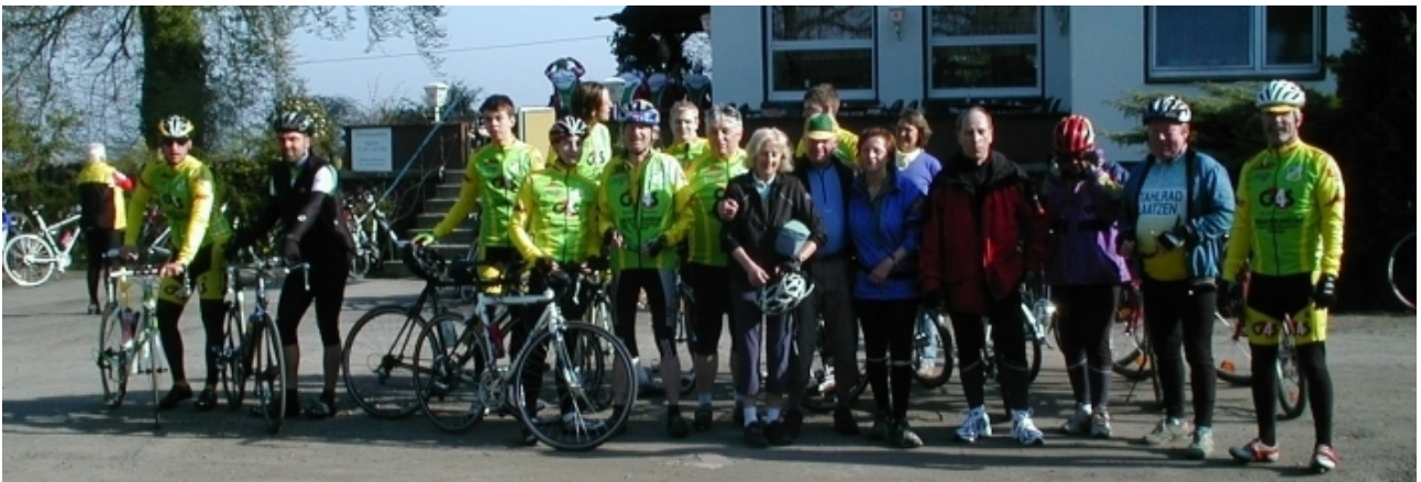
Das waren unsere Teilnehmer bei der Anfahrt nach Northen 2009

Nun zu unserer diesjährigen Saison. Sie beginnt wie immer am Karfreitag. In diesem Jahr ist es der 22. April mit der sogenannten Anfahrt zum Berggasthof Adamos am Benter Berg in Northen. Zum Start treffen wir uns um 8.30 Uhr am Alten Rathaus in Laatzten, Alte Rathausstraße 12.