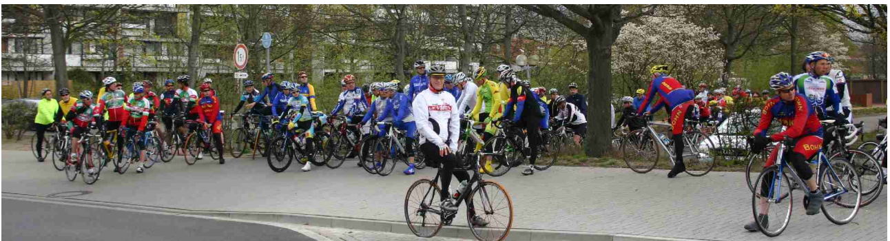
Kurz vor dem Start der ersten Fahrer um 12 Uhr

Etwa 200 Teilnehmer gingen bei wechselhaftem Aprilwetter zwischen 12 und 14 Uhr auf die ausgeschilderte Strecke über 45, 75 oder 115 km. Die Laatzener Polizei begleitete die Radler bis hinter Wülferode zur Kreuzung mit der Bundesstraße 443.