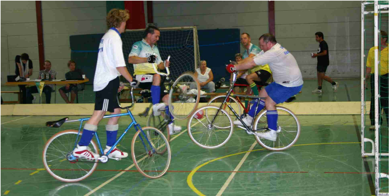
Radballszene bei einer früheren Veranstaltung

Unter dem schlichten Titel „Kreismeisterschaft 2012“ trifft sich die Radball-Elite am Sonnabend, den 29.09.2012 ab 12.30 Uhr in der Sporthalle Alte Rathausstraße.