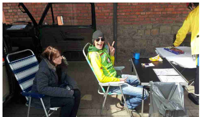
An einer Kontrollstelle unterwegs

Die letzten Teilnehmer kamen mit Kontrollschluss um 18 Uhr in Laatzten an. Dank unseres perfekten Helferteams klappte alles bestens. Allerdings konnte es nicht verhindern, dass einige Radler unterwegs in einige typische Aprilschauer gerieten.