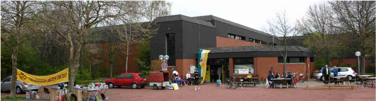
Bei den Vorbereitungen

Etwa 200 Teilnehmer gingen bei wechselhaftem Aprilwetter zwischen 12 und 14 Uhr auf die ausgeschilderte Strecke über 45, 75 oder 115 km. Die Laatzener Polizei begleitete die Radler bis hinter Wülferode zur Kreuzung mit der Bundesstraße 443.