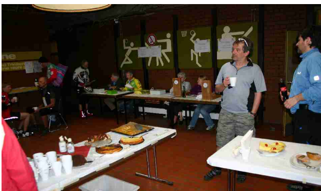
Kontrollzentrum in der Schule

Gut verpflegt an den Kontrollen in Dingelbe, Wesseln und Algermissen erreichten die ersten Radsportler das Ziel beim Erich Kästner Schulzentrum in Laatzten ab 14 Uhr.